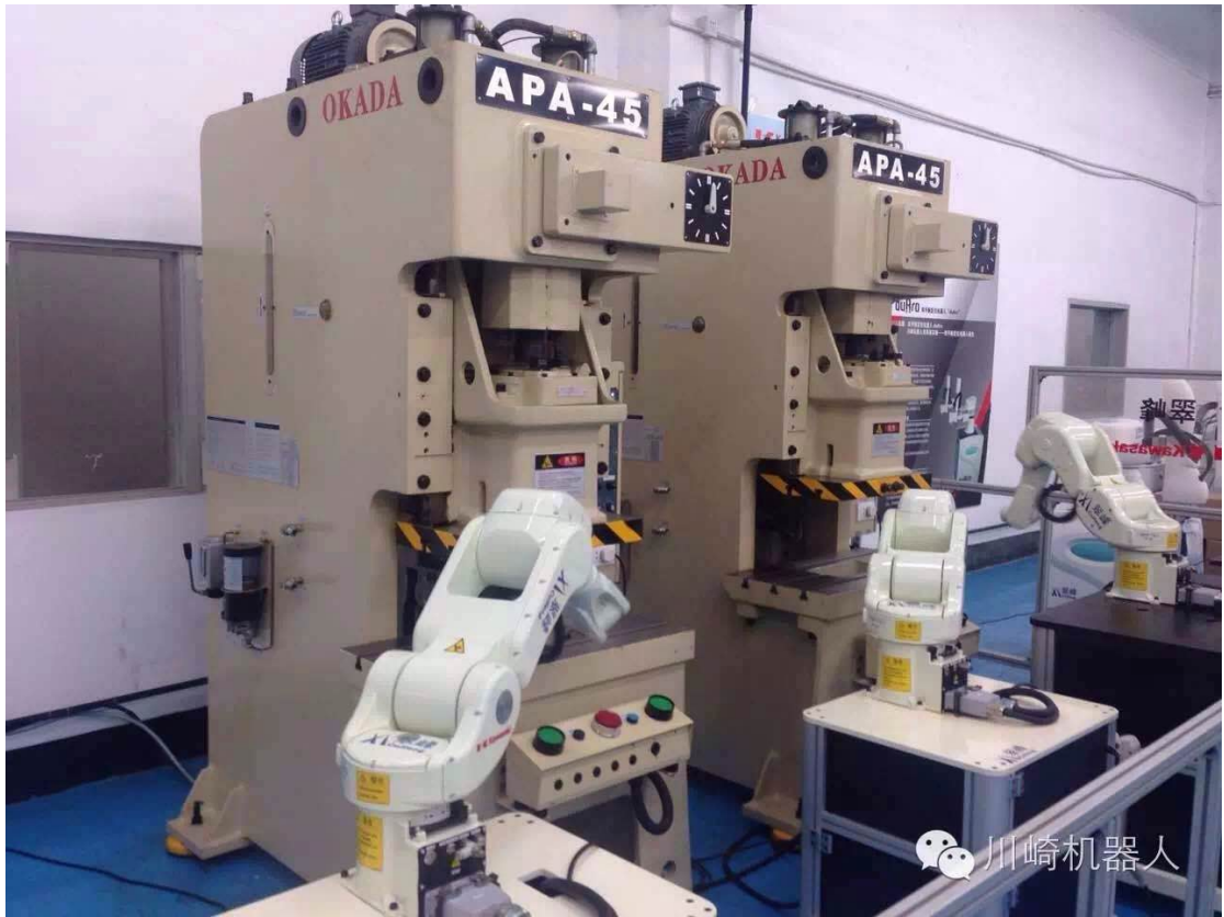
【大型电视终端监控触摸屏集中设定柔性机器人自动冲压方案】